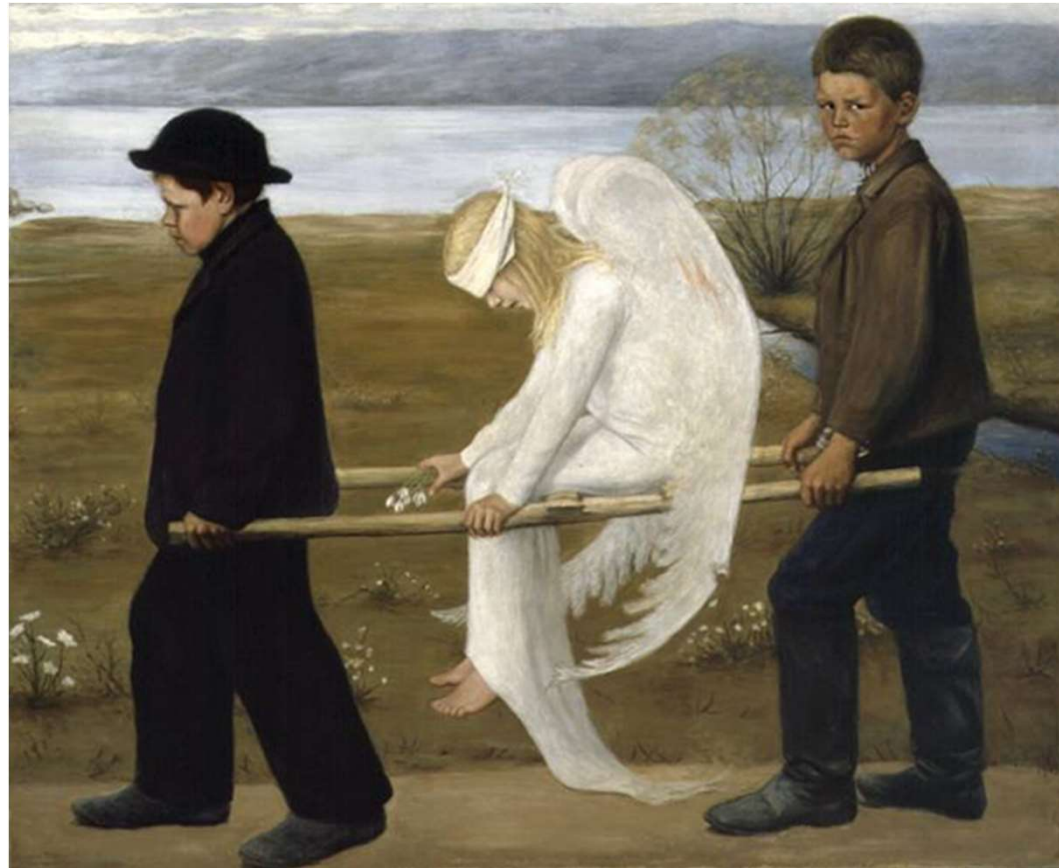
Hugo Gerhard Simberg: Den sårede engelen (1903). Konstmuseet Ateneum, Helsingfors