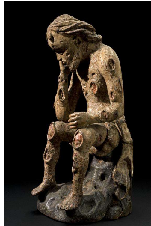
Utskåret figur av Job, Europa 1750 – 1850